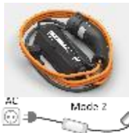
Кабел за зареждане Mode 2, Type EF - 8A