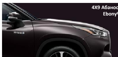
4X9 Абанос Ebony §