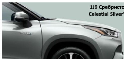
1J9 Сребристо Celestial Silver §