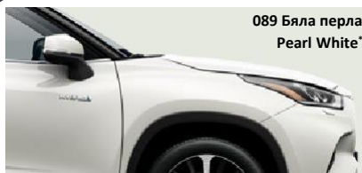
089 Бяла перла Pearl White §