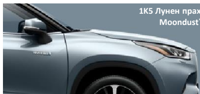
1K5 Лунен прах Moondust §