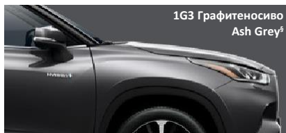
1G3 Графитеносиво Ash Grey §