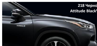
218 Черно Attitude Black*